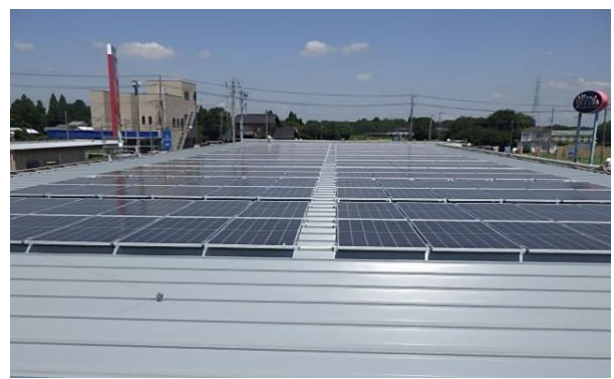
写真左：業務スーパー八街店 写真右：設置した太陽光パネル(店舗屋根上)

京成グループでは、長期経営計画「Dプラン」及び中期経営計画「D2プラン」に重点施策として「エコロジカルなまちづくりの推進」を掲げ、当社におきましても2023年9月にアルビス前原店、2024年10月堀切店に同設備を導入し、カーボンニュートラル実現に向けた取り組みを推進しております。