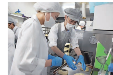
▲ 和洋女子大学とのコラボ