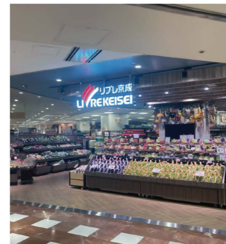
▲ 弊社の基幹店舗である八千代台コアエルム店の売場画像

当社は、安心・安全の京成電鉄(株)のグループ企業です。京成ストアは、「美味しい、いい暮らし。」をスローガンに掲げ、「お客様のニーズに合った価値のある商品とサービスを提供する」、「京成ストアに関わる人達の幸せに貢献する」これらを達成するために事業を運営しております。当社は、お客様はもちろんのこと、従業員、その家族、地域の皆様など多くの方々とのつながりにより成り立っております。人とのつながりが希薄に感じられる今だからこそ、それらの全ての方々に寄り添い豊かなくらし形成に貢献することを考え、行動することを掲げております。これらを実行することを通じて、「一緒に働く仲間とやりがいのある充実した人生を共に歩める会社」「社会との共生を積極的に図り、SDGsの達成に貢献する会社」「真に人から必要とされる会社」を目指しております。