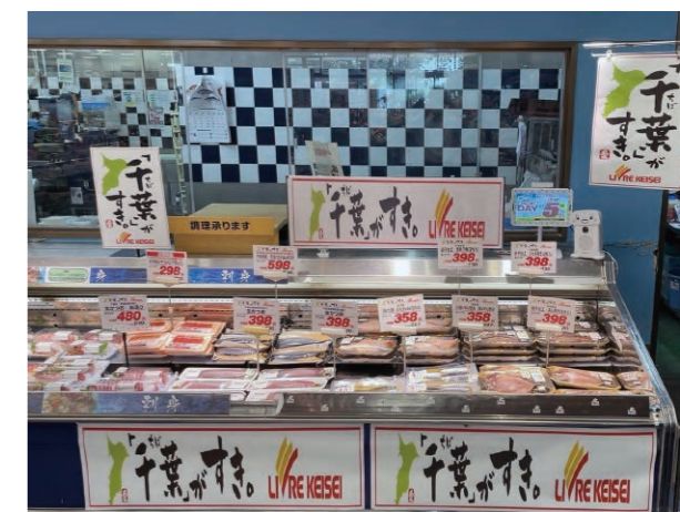
▲ 鮮魚売場には地元・千葉で採れた新鮮な魚が並ぶ。

一方、働く従業員に対しては、ワクワクして仕事に臨める環境の提供を第一に考えています。与えられた仕事をただ淡々とこなす歯車のような働き方ではワクワクは生まれません。従業員が自ら目的意識を持ち、チームの一体感やメンバーで物事を成し遂げる達成感を得られる組織づくりが必要になります。それを実現するために、サンクスカードキャンペーンをスタートさせました。職場の仲間に感謝の思いはあっても、面と向かって言うのは恥ずかしいもの。その思いをサンクスカードに書き、相手に渡すとともに、店舗の掲示板に張り出すというこの取り組みを通じて、職場にありがとうや笑顔の輪が広がり、チームのために頑張る意欲、活力が生み出されています。こうしたワクワク感が店舗を彩り、お客様、地域の皆様、取引先様にもプラスに働くのは言うまでもありません。食品スーパーの仕事のやりがいの根幹は、人の生活を支え、役に立っていることを実感できる点です。弊社には千葉県民の従業員が多いため、地元へ貢献できるやりがいの形もあります。チャレンジは大歓迎です。失敗してもそれを学びにまたチャレンジすればいいのです。ともにワクワクしながら挑戦を続け、道を切り拓きましょう。