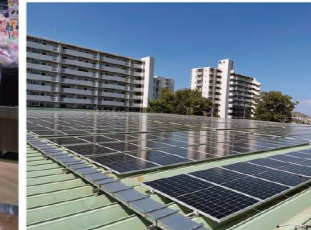
▲ 太陽光発電設備の導入