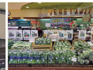
▲ 千葉県産の食べ物を千葉県で消費する取組